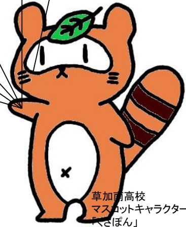
草加南高校 マスコットキャラクター 「くさぼん」